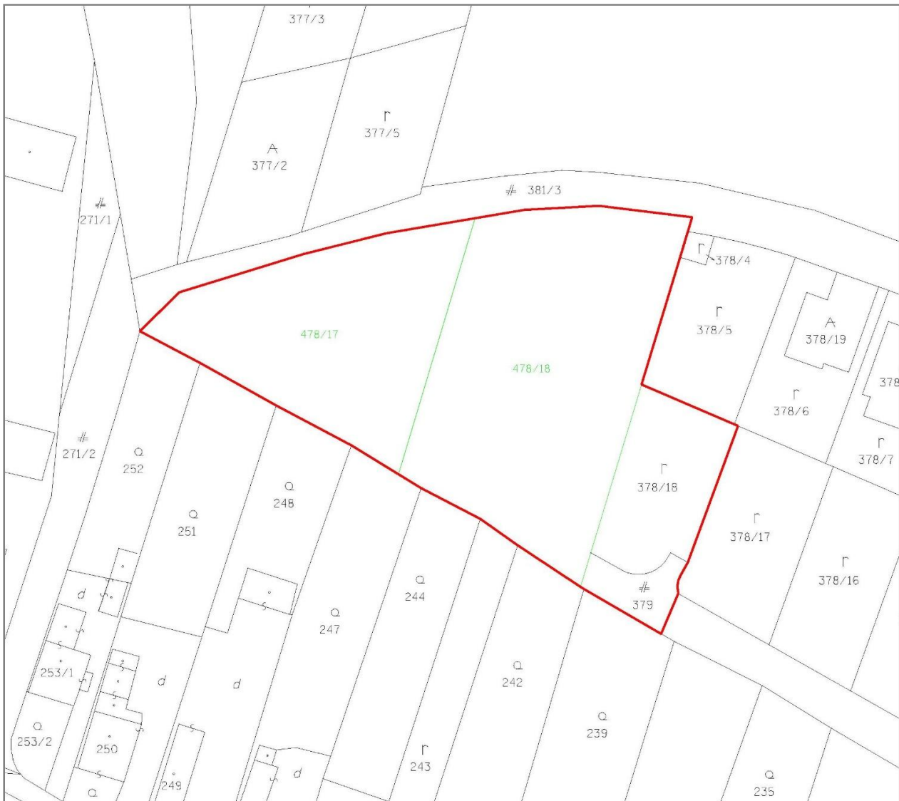
Obr. č. 1 – Obvod projektu pozemkových úprav